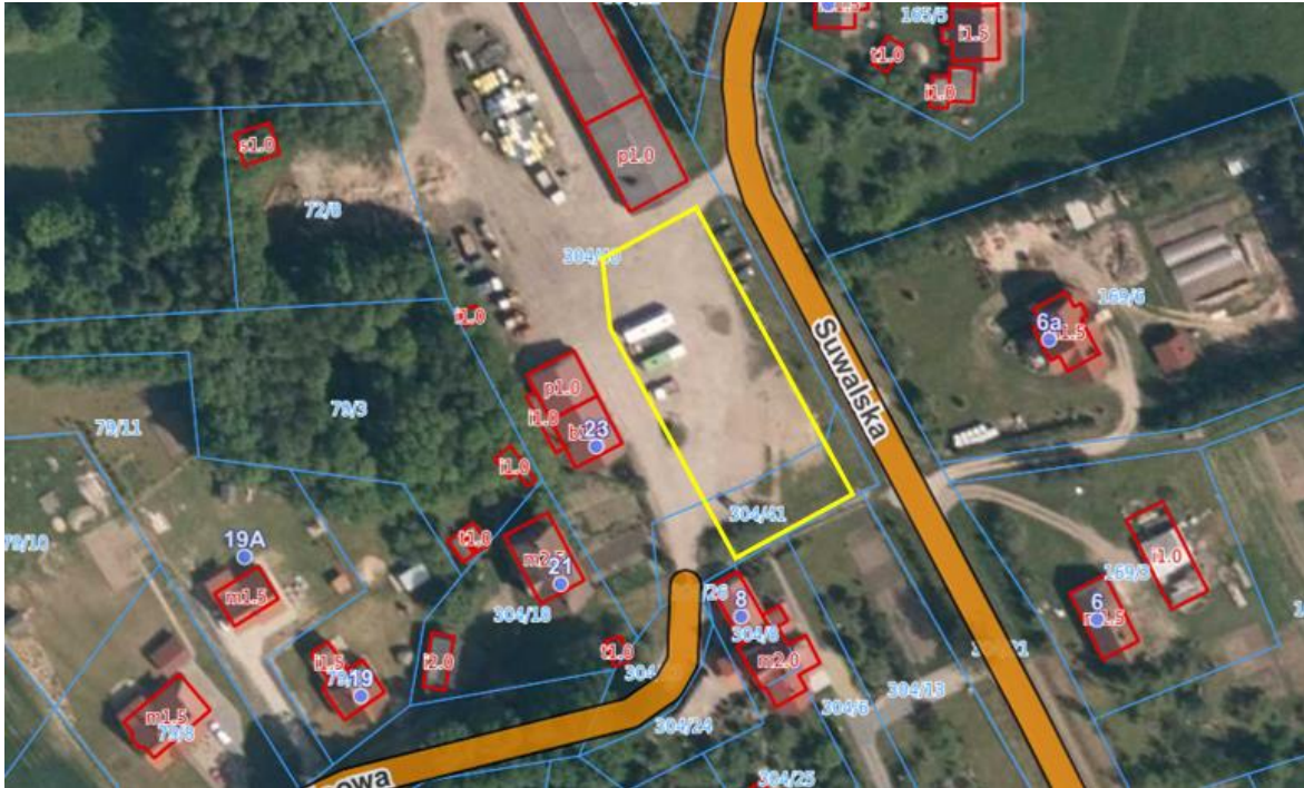
Rysunek 3. Dostępne sieci uzbrojenie działki.